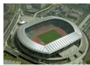
横浜国際総合競技場